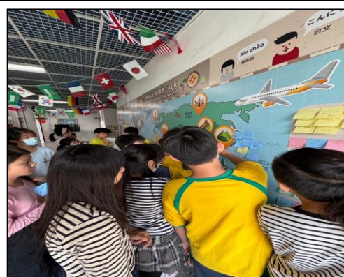
貼上便利貼的同時，也認識其他國家。