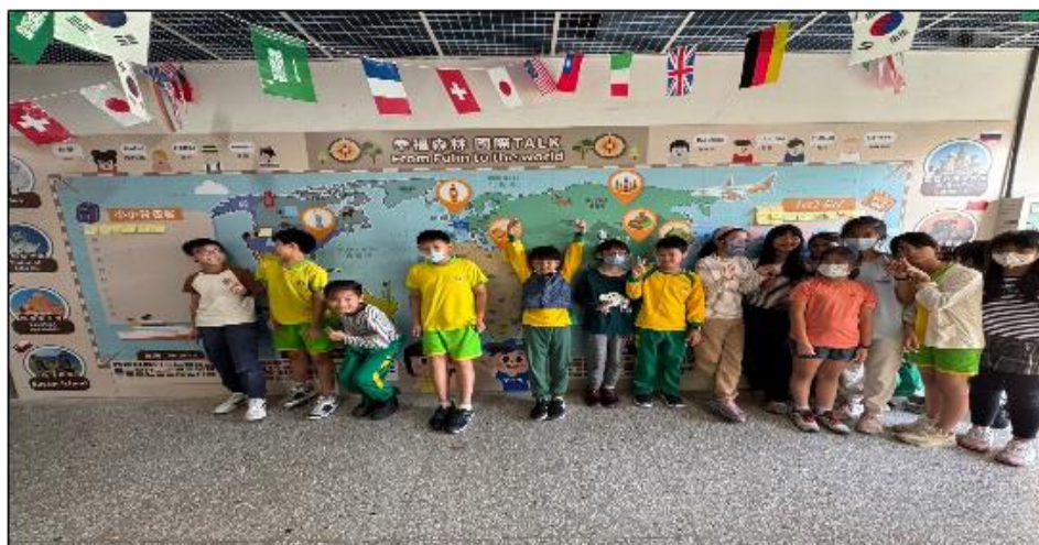
全校同學在世界地圖用英文書寫貼上自己曾經去過的國家、城市。