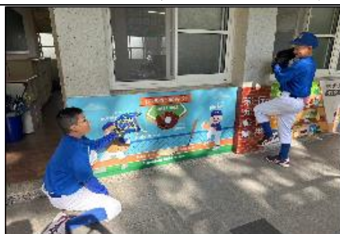
棒球隊在大圖前認識自己的守備及棒球術語英文。