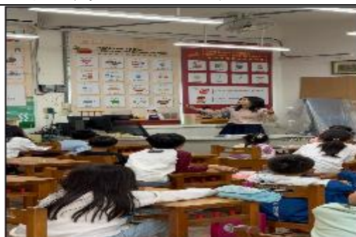
老師利用捲簾來讓學生認識文具。